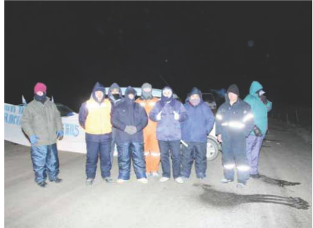
Los desocupados se retiraron de forma voluntaria de la ruta.