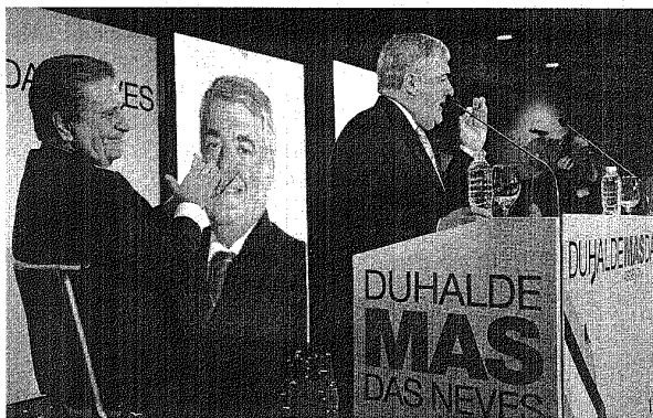
Das Neves se dirige al público y Duhalde aplaude durante el lanzamiento del jueves.