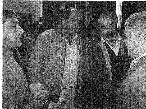
ACOMPANADO. EL GOBERNADOR SALUDÓ EL APOYO DE LOS GREMIALISTAS.

Por otro lado, el gobernador hizo referencia al escándalo Schoklender, con ramificaciones en Chubut. En tal sentido advirtió que "somos todos los argentinos los primeros que reivindicamos la lucha de Madres y Abuelas