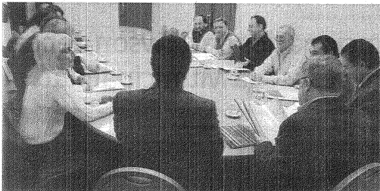
REUNIÓN POR LA CENIZA. TRES DEPARTAMENTOS DE CHUBUT FUERON DECLARADOS EN EMERGENCIA AGROPECUARIA.

E l gobierno de Chubut declaró ayer la emergencia agropecuaria para los Departamentos Telsen, Mártires y Gastre, afectados por la caída de ceniza volcánica, tras una reunión que el propio gobernador Das Neves mantuvo con entidades rurales chubutenses. Con la medida, el Estado provincial destinará de manera inmediata entre 5 y 7 millones de peso en apoyo a los productores, los que serán independientes de otros 5 millones que prometió Nación ante el pedido que formularon el martes últimas autoridades de esta provincia.