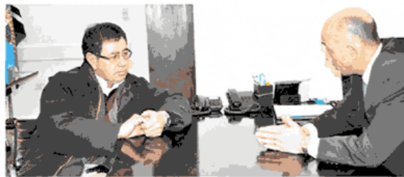
Los Intendentes se mostraron preocupados por los conflictos sociales en la región.

Vale decir que en días venideros, un nuevo encuentro los llevará a la ciudad de Buenos Aires, donde los Intendentes avanzarán en gestiones de obras que generarán puestos de trabajo; además de propiciar el avance social, tecnológico y estratégico para la zona. Una de las más importantes es el acueducto que, desde el Lago Buenos Aires, abastecerá a toda la región del vital elemento, y además brindará el recurso necesario para desarrollar amplias zonas de