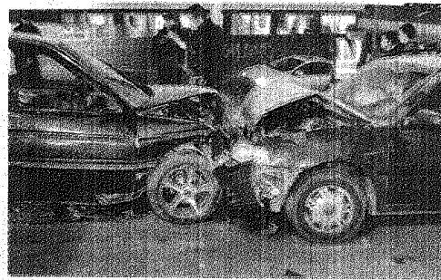
El fuerte choque frontal se produjo en el cruce de Mitre y Marta Crowe.

Según se supo, el conductor del automóvil no habría entendido la señal dada por el