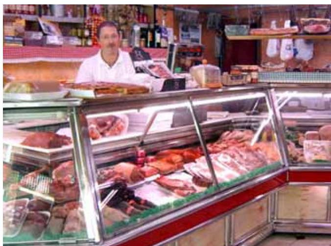
El consumo ante la disyuntiva

El segundo relevamiento realizado durante el año en los comercios de la ciudad por la Sociedad Comercio e Industria de Junín indica que los niveles de comercialización se han incrementado levemente en sus porcentajes. La actividad, en sí, sufrió una suba interanual del 3,28 por ciento una vez descontada la inflación según la redacción del informe. A su vez, la relación intermensual tuvo un avance del 4,87 por ciento con una evolución dispar entre los sectores consultados.