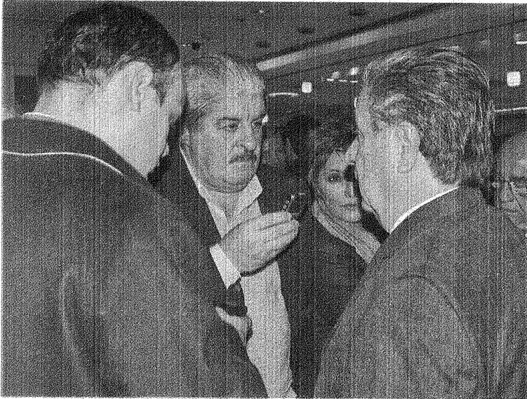
MANO A MANO. DUHALDE DIALOGANDO CON JORNADA EN BUENOS AIRES. UNA ENTREVISTA DONDE NO SE GUARDÓ NADA.

El compañero de fórmula del gobernador Mario Das Neves la segunda vuelta y después a la conducción del país. Lo