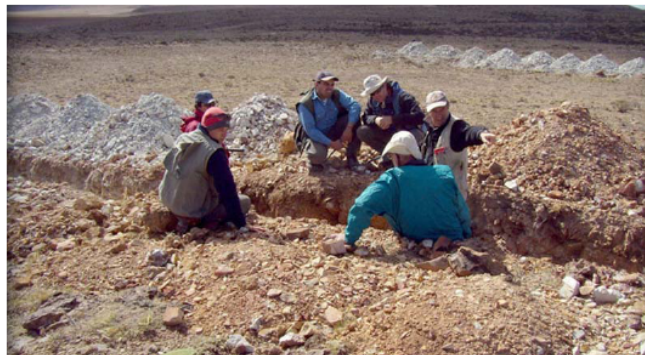
Mariana Resources anunció su programa de exploraciones en el proyecto de oro y plata Sierra Blanca.