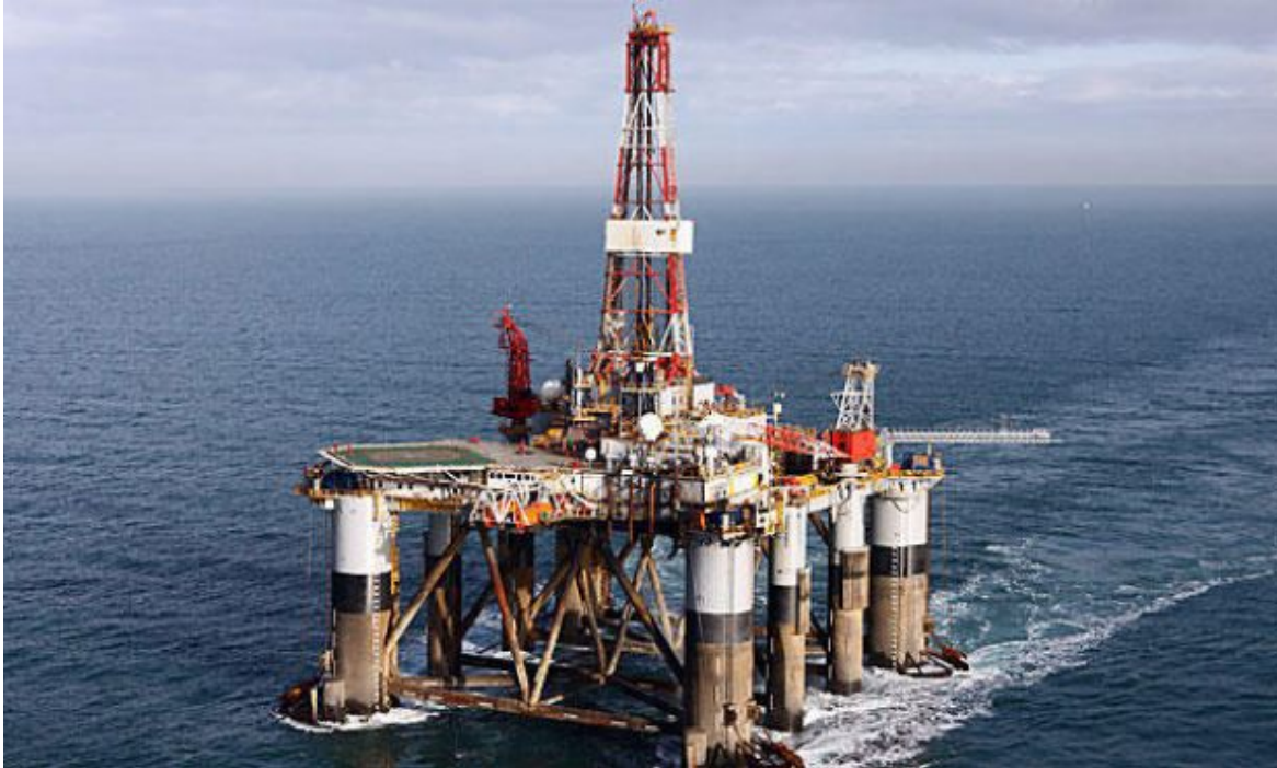
Plataforma Ocean Guardian, utilizada por Rockhopper en su exploración.

La petrolera británica anunció que en bloque Sea Lion "fluyen de manera estable 5.508 barriles diarios". Sin embargo, la noticia fue fríamente recibida por los inversores que estarían a la espera de datos más concretos. En el Reino Unido dicen que otro hallazgo terminaría con las dudas.