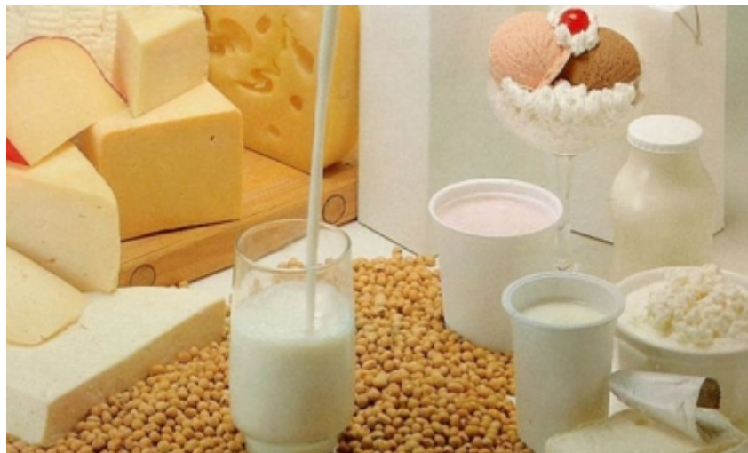
Productos típicos de la canasta básica más caros.

Se vienen nuevos aumentos en pan, azúcar, lácteos, yerba y agua