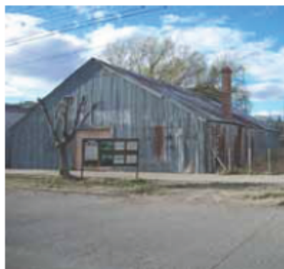
El Museo antes de la primera etapa.

Obras - Los trabajos constan de dos etapas, la primera ya concluida, que incluyó la restauración y adecuación a la época del galpón existente con instalaciones generales de 235,03 metros cuadrados. La segunda etapa consistirá en la construcción de administración, sanitarios, restauración y obras semi cubiertas (corrales y mangas) que es la próxima a realizarse. Se estima que quede terminada dentro de unos cuatro meses.