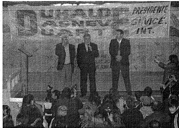
El candidato a vicepresidente comparti  un acto con postulantes de Jos  C. Paz, en la provincia de Buenos Aires.

Adem s el saliente gobernador de Chubut se reuni  con la embajadora de Estados Unidos, empresarios y directivos de la Asociaci n de Bancos de la Argentina (ABA) donde los candidatos de Uni n Popular expusieron el plan de gobierno focalizado en apuntalar la pol tica productiva y la situaci n financiera de la Argentina.