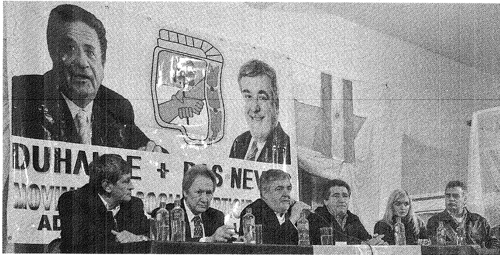
AYER NOMÁS. EL GOBERNADOR Y CANDIDATO A VICEPRESIDENTE, DURANTE UNA PRESENTACIÓN DE CANDIDATOS LA SEMANA PASADA, EN LANÚS.