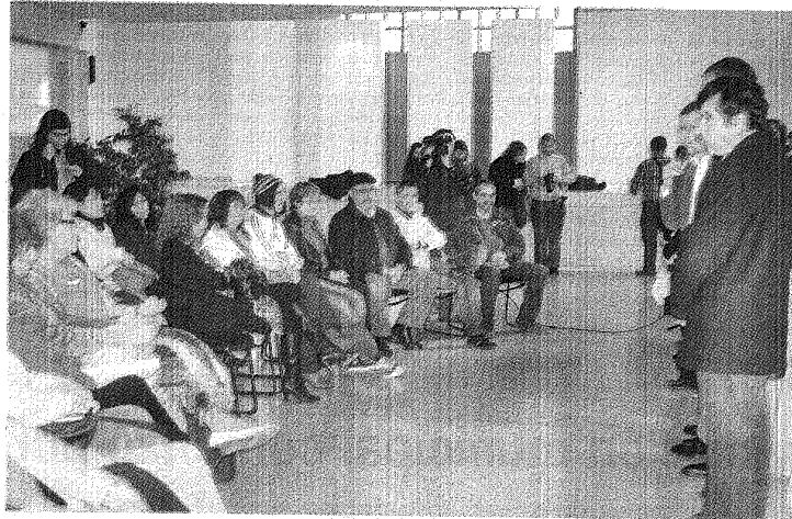
Referentes de distintas instituciones recibieron aportes de dinero para los diversos proyectos votados en cada área.

El segundo proyecto correspondió al Centro Cultural y Recreativo para la Inclusión Social de Personas con Discapacidad. La entrega de este aporte permitirá la ejecución del anteproyecto