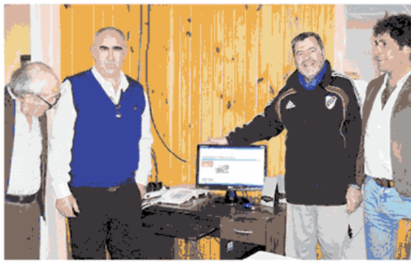
En la estancia de la zona se cuenta además con Internet.

"Y como en toda reunión se tocan los temas de actualidad donde las opiniones son diversas, pero que concuerdan al momento de saber que cada uno de nosotros tiene una gran responsabilidad, en mi caso como Intendente elegido por