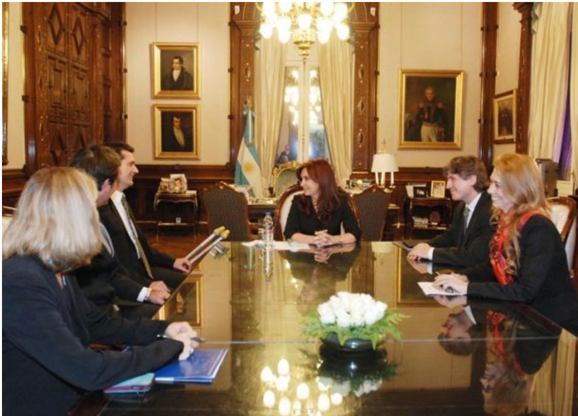
Cristina Fernández recibió a directivos de BlackBerry.

Hewlett Packard, la mayor empresa de tecnología de la información del mundo, comenzará en noviembre a fabricar computadoras portátiles en la Argentina, iniciando un proceso progresivo de inserción de componentes e integración de partes de origen nacional.