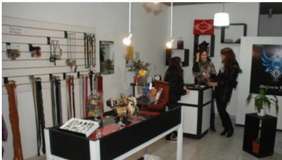
Mujeres de Linaje y todo tipo de accesorios para la mujer de hoy, en la zona sur de Trelew.

Así lo manifestaron los comerciantes de la ciudad. No obstante, observan un movimiento incipiente que esperan que crezca a medida que se acerque la fecha. Accesorios de todo tipo, libros, prendas textiles y pequeños productos de regalaría son las ofertas más buscadas.