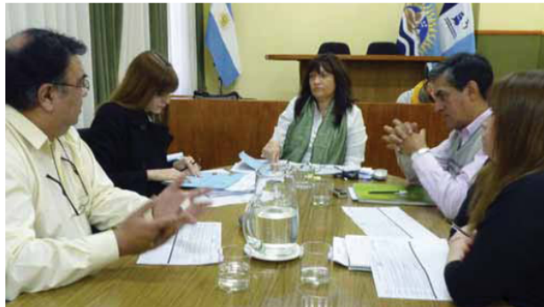
Sólo tuvo despacho favorable en comisión de transporte.

Entrevista - En diálogo con TiempoSur , el Concejel que propuso el proyecto explicó cuales eran los objetivos del mismo, como así también las instancias en las que se encuentra el expediente. "Nosotros tenemos un debate permanente vinculado con los precios. Lo que pretendemos a través de este espacio institucional, con anticipación de diferentes entes. Tenemos la posibilidad de conocer los precios bases, por lo que la idea es estudiar-