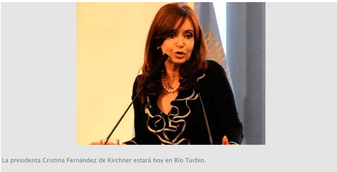
La presidenta Cristina Fernández de Kirchner estará hoy en Río Turbio.

Lo hizo al referirse en Mar del Plata a la visita que realizará hoy a la Cuenca Carbonífera, acompañada del gobernador, para observar el avance de la construcción de la usina termoeléctrica. También volvió a referirse a las represas hidroeléctricas y al interconectado.