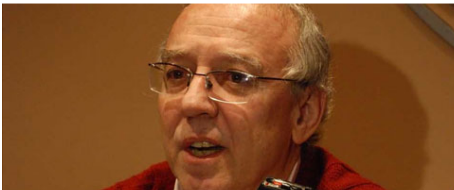
MAC KARTHY PONE SU GENTE