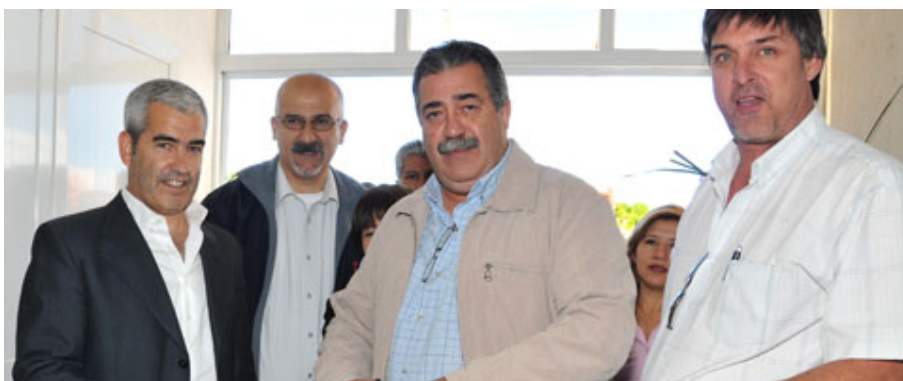
INTERNA K EN EL SINDICALISMO