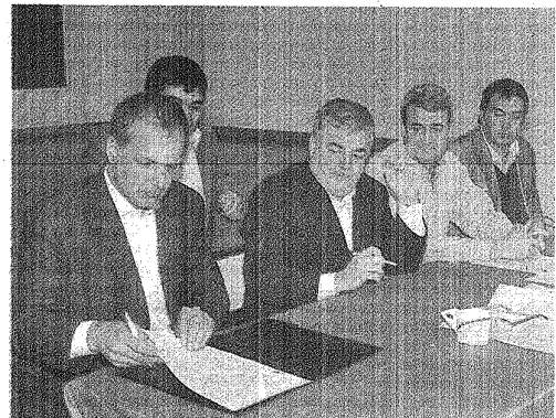
EL GOBERNADOR FIRMÓ CONTRATOS DE IMPORTANTES OBRAS.

"Donde la vida me ubique, donde esté, siempre voy a ser uno más como ustedes", dijo Das Neves en Comodoro.