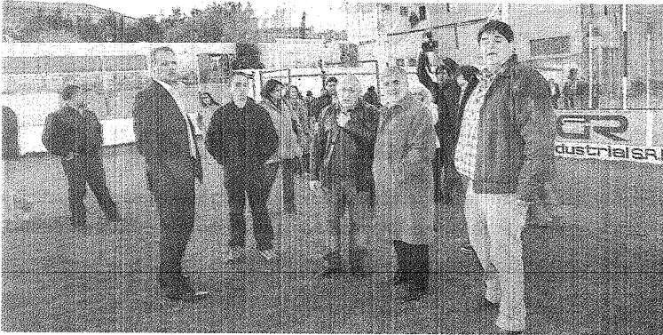
DAS NEVES RECORRIÓ Y VISITÓ DIVERSAS ENTIDADES DEPORTIVAS DONDE SE EJECUTAN OBRAS DE INFRAESTRUCTURA.