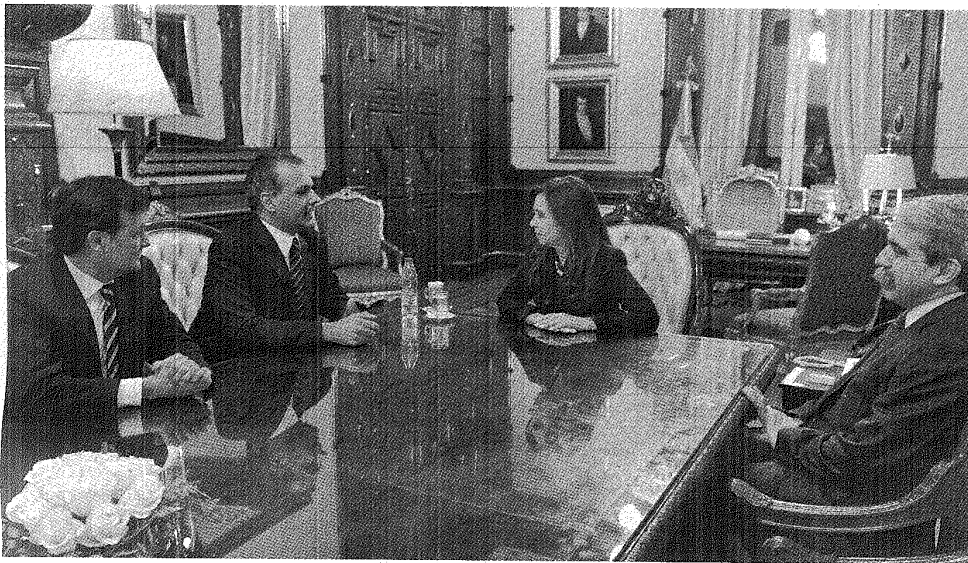
El apoyo de los nuevos gobernantes de Chubut a la reelección de Cristina Kirchner tuvo amplias repercusiones en la provincia.

“La idea es que tenemos que tener una relación madura con la Presidencia de la Nación, la ocupe quien la ocupe, y con las autoridades provinciales”, manifestó.