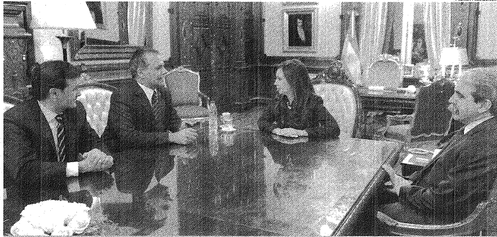
CUARTETO: MAC KARTHY, BUZZI, CRISTINA FERNÁNDEZ Y ANÍBAL EN LA REUNIÓN QUE CAUSÓ UN TEMBLADERAL EN EL ESCENARIO POLÍTICO CHUBUTENSE.

El mandatario dijo sentirse mal "en lo humano". Y aseguró que el Gobierno nacional esperó el momento para recibir a la fórmula que gobernará Chubut "para intentar dañarme". Remató: "La ciudadanía detesta este tipo de actitudes".