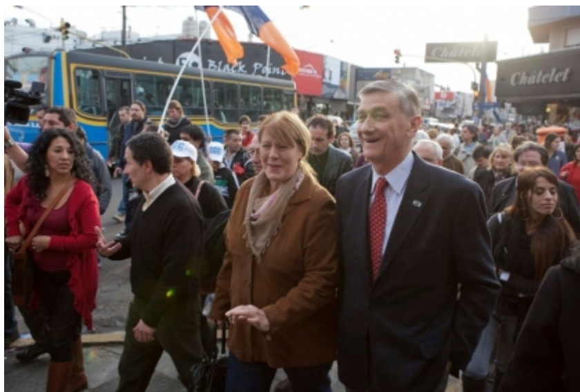
Binner y Stolbizer recorren La Matanza.

El gobernador de Santa Fe y candidato a Presidente por el Frente Amplio Progresista, señaló que esa fuerza "está trabajando para ganar las elecciones. Hoy estamos visitando La Matanza, pero llegaremos también a ciudades más pequeñas y a pueblos, porque sabemos que los grandes cambios vienen de la mano de la gente".