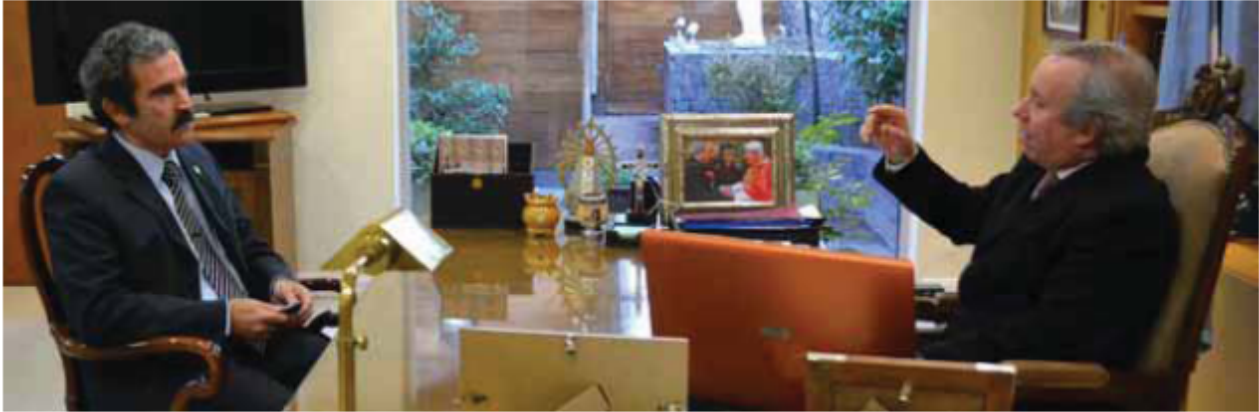
El Jefe Comunal junto al Gobernador.

Lo indicó ayer el Jefe Comunal de Puerto San Julián durante su paso por Río Gallegos. Visitó al gobernador Peralta, en donde dialogaron sobre la próxima licitación del plan de viviendas y el parque eólico.