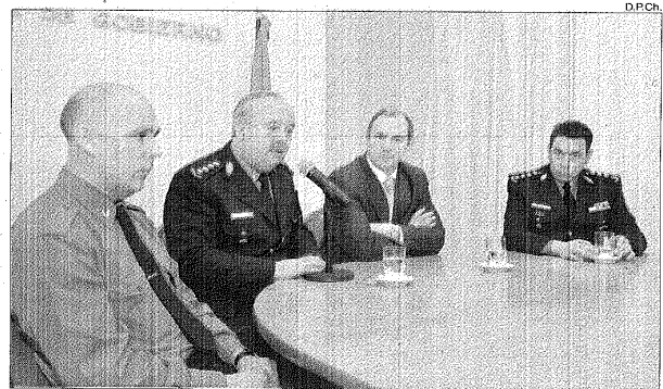
Conferencia. Las autoridades dijeron ayer que en una comisaría de la zona del valle se realizará "una prueba piloto" para que los uniformados puedan observar los beneficios del sistema que implica, entre otras cosas, un descenso en la carga semanal de 56 a 48 horas.

También sostuvo que "se está planteando otra alternativa que nosotros creemos que no reúne las condiciones de descanso, de continuar con el servicio de tercios de rotativos y