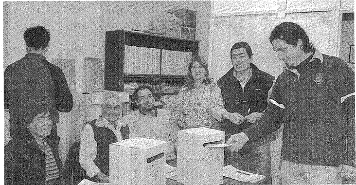
ANOCHER DE UN DÍA AGITADO. ANOCHÉ SE CONTABA VOTO A VOTO PARA DEFINIR LA CONDUCCIÓN DEL GREMIO ESTATAL.

Mientras que la junta electoral contaba los votos en uno de los cuartos laterales de la sede del sindicato