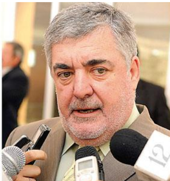
Mario Das Neves, gobernador de la provincia de Chubut.

(Por Renato de la Cruz) - Chubut, mucho más que unas primarias: El domingo que viene se dirimen candidaturas nacionales y espacios de poder. El mapa político definirá las relaciones al menos hasta octubre, y permitirá ordenar alineamientos. En Chubut, no es lo mismo cualquier resultado. Se juega la chance de tener un vicepresidente.