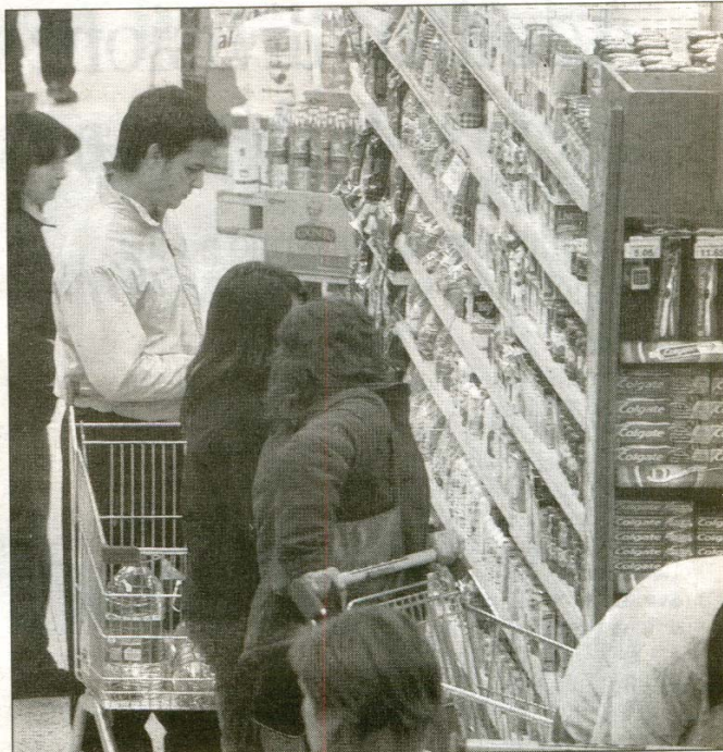
Los alimentos subieron, según el organismo oficial, el 0,8% durante julio.

La suba de precios oficial resultó la mitad que la calculada por economistas y consultoras privadas, cuyas estimación de 1,6 por ciento fue difundida por legisladores nacionales para evitar sanciones por parte de la Secre-