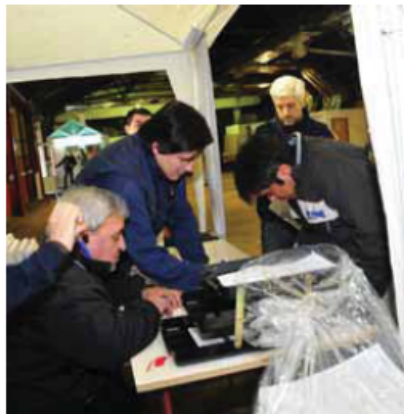
Los beneficiarios llenaron el formulario y recibieron sus equipos.