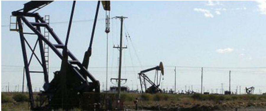
IMPULSARÁ UNA LEY