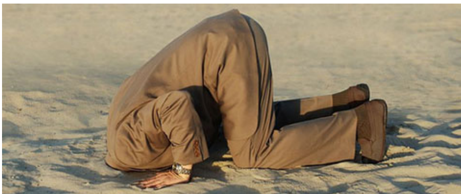
PASIVO AMBIENTAL: HAY 2.444 POZOS ABANDONADOS EN EL EJIDO DE COMODORO