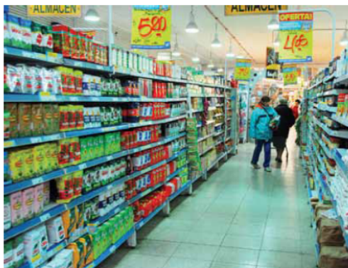
Algunos aumentos ya rigen. El resto se aplicará en los próximos días.