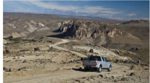
La minera Goldcorp opera en cercanías de Perito Moreno.

Cerro Negro es uno de los proyectos de oro más importantes del país, y está ubicado unos 50 kilómetros al sudeste de Perito Moreno, en el extremo noroeste del productivo Macizo del Deseado. Con