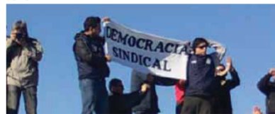
Petroleros esperan el llamado a elecciones.