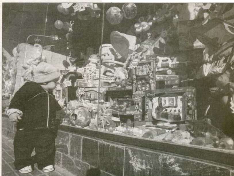
Entre los más chiquitos, la predilección se inclina por las figuras de la cinta “Toy Story” y toda la línea de “Cars”.

La empleada de un local multi rubro señaló que “la gente mira y mira, y cuando tiene que hacer varios regalos, opta por elegir precio sobre calidad”. “Tenemos muchas cosas,