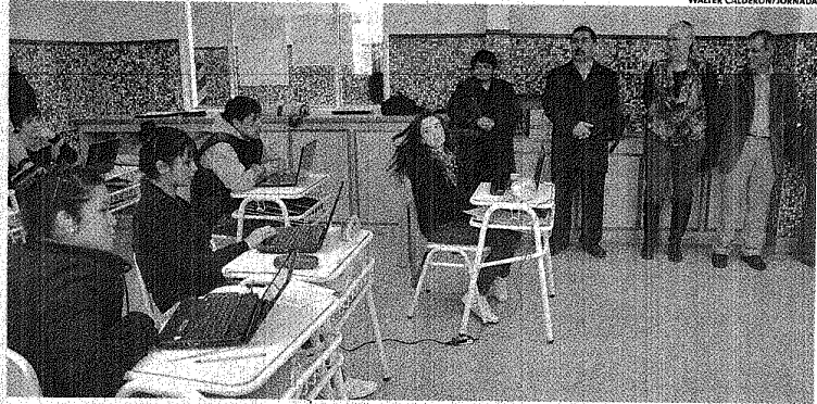
LOS ELEMENTOS FUERON ADQUIRIDOS A TRAVÉS DEL PRESUPUESTO PARTICIPATIVO. EL MONTO UTILIZADO FUE DE 51 MIL PESOS.