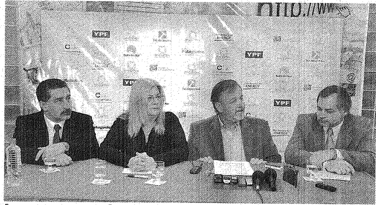
ENTRE LOS EVENTOS SE DESTACA LA FERIA GASTRONÓMICA QUE SE REALIZARÁ LOS DÍAS 9,10 Y 11 DE SEPTIEMBRE.

Con estas palabras, arraigadas en el Decálogo del Inmigrante, la Federación trabaja en pos de la conservación de los valores que conforman el ser patagónico, ya que, como asumió la principal autoridad de la organización, "tenemos la fuerte convicción de que con el ejemplo de nuestros pioneros patagónicos, es posible convertir sueños en realidad, alcanzar metas, conservar raíces y, sobre todas las cosas, vivir bajo el manto del respeto, la tolerancia, el amor, la integración, la solidaridad y la esperanza en el porvenir. #