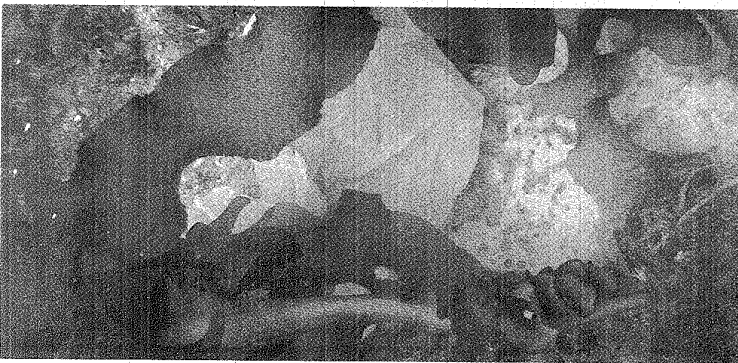
LA DISPOSICIÓN DE LOS RESIDUOS DEL HOGAR ES EL INTERROGANTE PARA LOS SECTORES MÁS VULNERABLES QUE USAN BOLSAS DEL SUPER.

evitar la contaminación en el entorno que conlleva el uso indiscriminado de las mismas, acompañado con una adecuada estrategia de Educación y Comunicación Ambiental, con las demás acciones enmarcadas en el Plan Estratégico Provincial de Gestión Integral de Residuos Sólidos Urbanos.