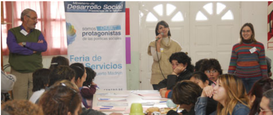
EN APORTES A ECONOMÍA SOCIAL