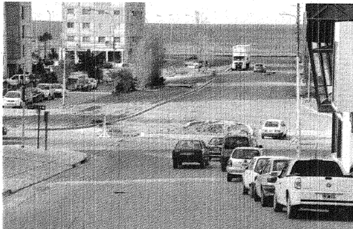
■ En la intersección de Yrigoyen con Escribano y Punta Piedras se instaló un semáforo de tres tiempos.

Para avanzar con la obra del shopping que se construye sobre la costanera del barrio Cívico, resulta necesario cerrar el tránsito durante alrededor de un año en el tramo sur de la avenida Ducós. Por esa razón, se debió modificar la circulación vehicular de la avenida Yrigoyen, convirtiéndose en doble mano en el sector entre la propia Ducós y la calle Punta Piedras.