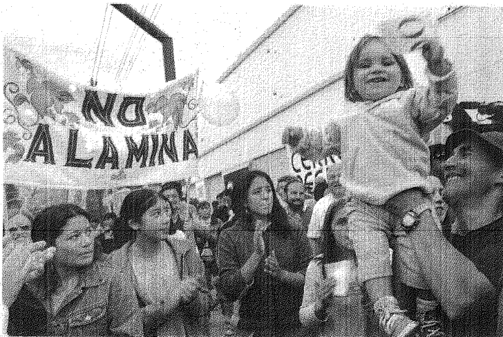
■ Una nueva marcha contra la mega minería se realizará hoy en la provincia.

el que se plantea que "el gobierno y las mineras están trabajando para derogar la ley 5.001 (que prohíbe la explotación minera en Chubut), que es un logro alcanzado por los propios vecinos de la cordillera y que es la única herramienta legal para defendernos de este tipo de explotación".