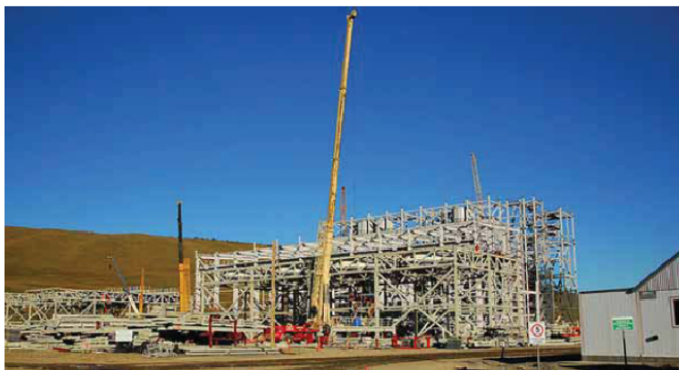
Construcción de la Megausina en Río Turbio.

En la web - Es necesario recordar, que desde el blog de la organización ambientalista en el mes de agosto, denunciaron que no es posible darle