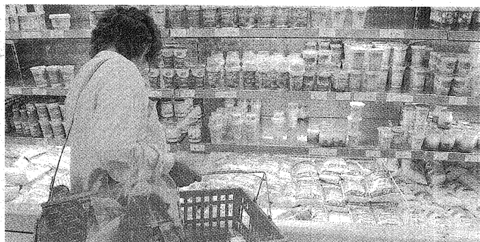
EN TRABAJO. SI BIEN LOS GERENTES DE SUPERMERCADOS SE MOSTRARON ACCESIBLES, EL TEMA SE RESOLVERÁ EN LA SECRETARÍA.