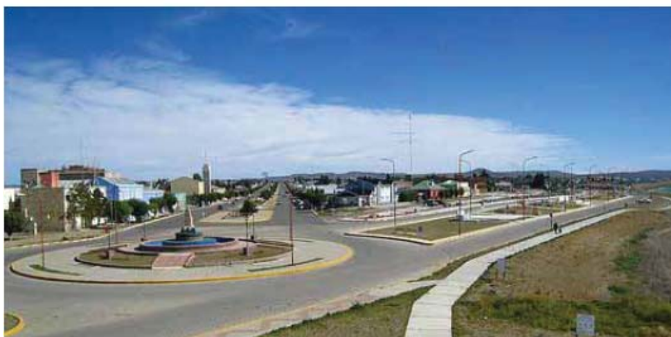
La ciudad se encuentra en pleno progreso.