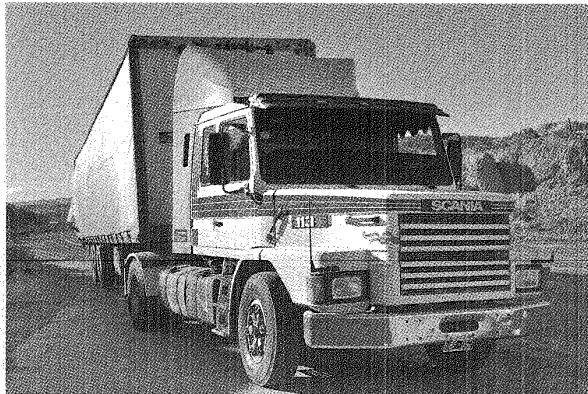
Valerio Gómez / El Patagónico

■ El camionero fue sorprendido con una botella de fernet en la cabina del camión que transportaba mercadería para un supermercado.