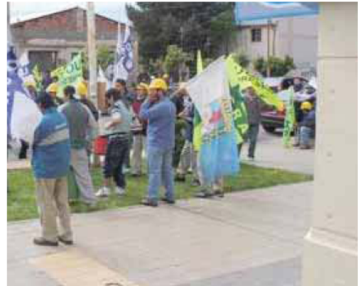
Los trabajadores esperan por las elecciones.

Sin embargo las negociaciones están trabadas ya que tienen problemas con la Cámara que pretendería