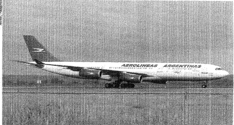
■ Tras suspender sus operaciones el lunes y también en la mañana de ayer, un avión de Aerolíneas voló por la tarde a Comodoro Rivadavia.

per la cantidad de vuelos semanales que tenía hasta el 4 de junio, cuando entró en erupción el volcán chileno Puyehue, que por estos días registra una menor actividad. Guinle se contactó con el presidente de Aerolíneas Argentinas, Mariano Recalde y también gestionó con la Administración Nacional de Aviación Civil (ANAC) la instalación de aparatos medidores de cenizas en los aeropuertos tanto de Trelew como de Comodoro Rivadavia.