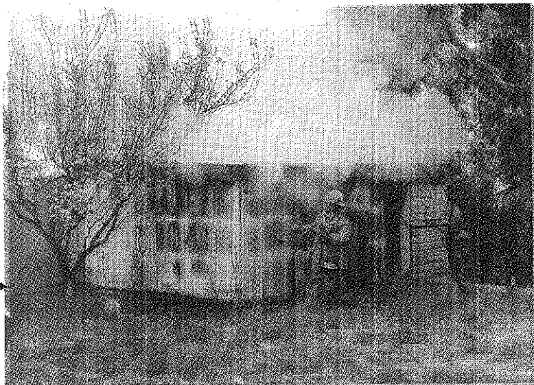
Valerio Gómez / Patagónico

■ Los bomberos combaten el siniestro en el antiguo galpón donde quemaban basura.