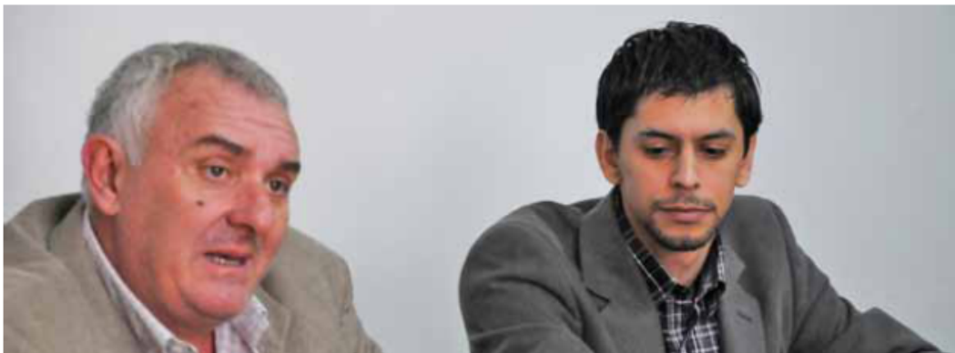
A través de este acuerdo estarán interconectadas 270 escuelas. (L. F)

Enmarcado en el proyecto “Conectados con el progreso”, ayer al mediodía el titular de Educación y Canal 9, llevaron a cabo la firma de un convenio de comodato de la planta transmisora para que la señal televisiva sea recepcionada en todos los establecimientos educativos.