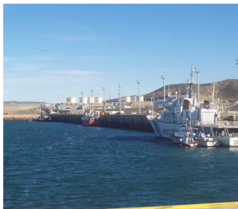
Afirman que las mejoras en Caleta Paula no afectarán labores en Deseado.

Los proyectos no se pueden llevar adelante solos y se puede dar esta posible complementación, vamos