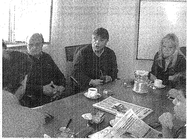
EN LA REUNIÓN SE ANALIZARON DISTINTOS TEMAS.

Paralelamente a ello, en trabajar para la unidad del justicialismo en Chubut. #