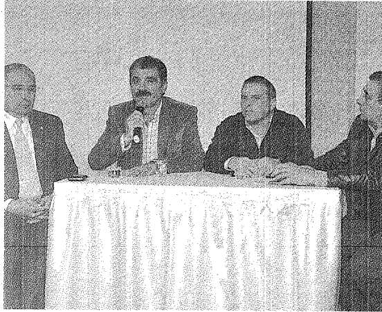
LOS RESIDUOS SÓLIDOS URBANOS COMO POLÍTICA PÚBLICA CON CONTINUIDAD.