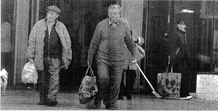
BOLSAS NUEVAS. LA GENTE RECURRIÓ A DIFERENTES OPCIONES PARA RETIRARSE CON SUS COMPRAS DE LOS SUPERMERCADOS.

El acuerdo para eliminar las bolsas de plástico en los supermercados e hipermercados de la comarca del Valle Inferior del Río Chubut y Península Valdés (Virch-Valdés) comenzó con un fuerte cambio de costumbre de la gente que salió de los